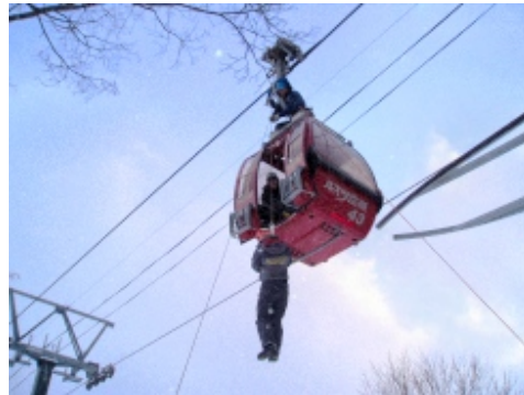
◆6人乗りゴンドラの救助訓練の様子(H19.11.21)