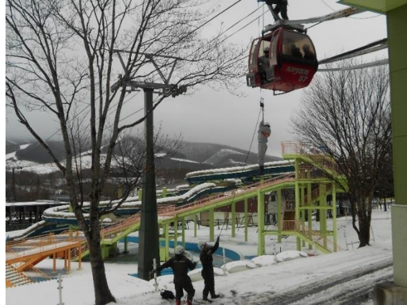
◆ 冬期営業前 4人乗りリフト及び6人乗 Gondola 救助訓練 (H25.11.21)