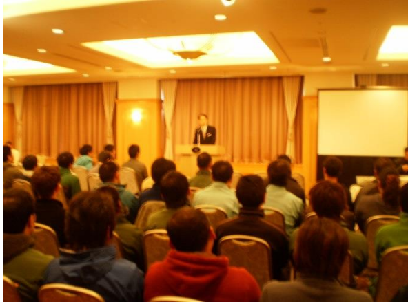
◆ルスツリゾート全従業員対象の研修会(H25.11.21)

技術研修会 :平成25年10月30日(ワイヤーロープ持ち上げ機について、使用方法について研修)