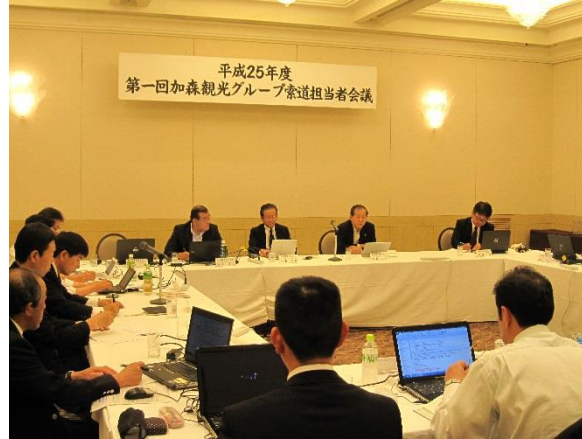
◆加森観光グループ索道担当者会議(H25.6.18)

(3) 社内保安監査部門による内部監査を実施し、索道施設や安全管理について問題点の提起、改善に努めました。