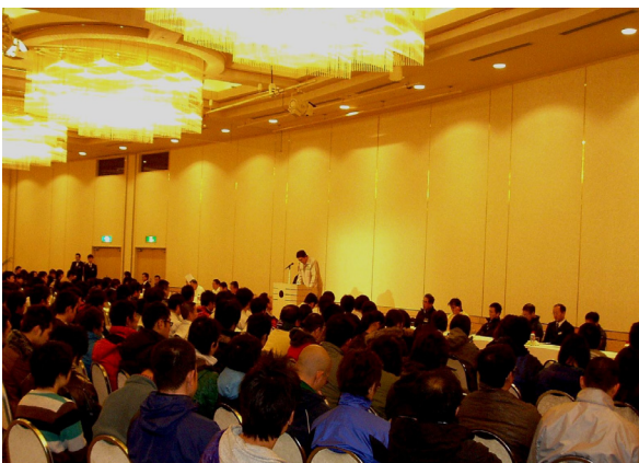
◆全従業員対象の研修会(H20.11.20)