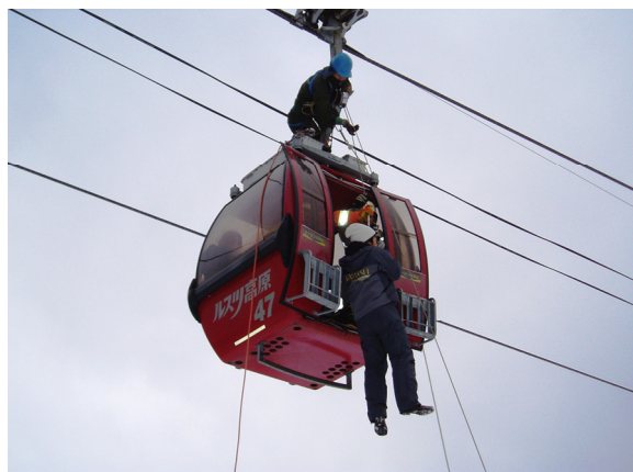
◆6人乗りゴンドラの救助訓練 (H2011.20)