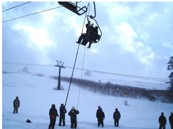
◆2人乗りリフトの救助訓練 (H2011.20)