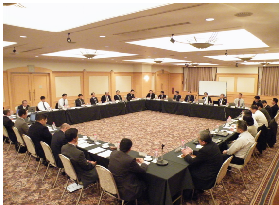
◆加森観光グループ索道担当者会議(H20.10.20)