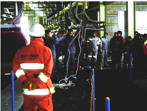
◆救助用具の取扱訓練 (H20.11.20)