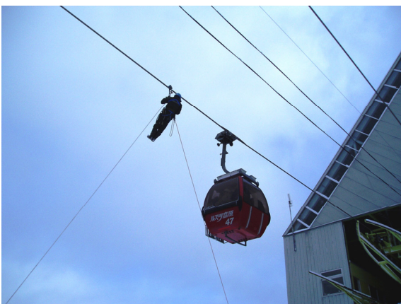
◆6人乗りゴンドラの救助訓練 (H2011.20)