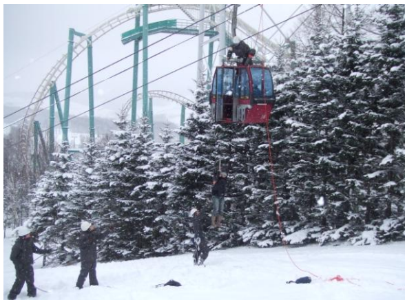
◆4人乗りゴンドラの救助訓練(H21.11.20)