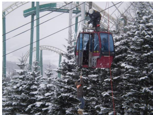
◆4人乗りゴンドラの救助訓練(H21.11.20)