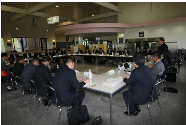
◆加森観光グループ索道担当者会議(H21.11.2)