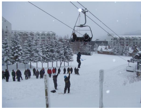
◆4人乗りリフトの救助訓練(H21.11.20)