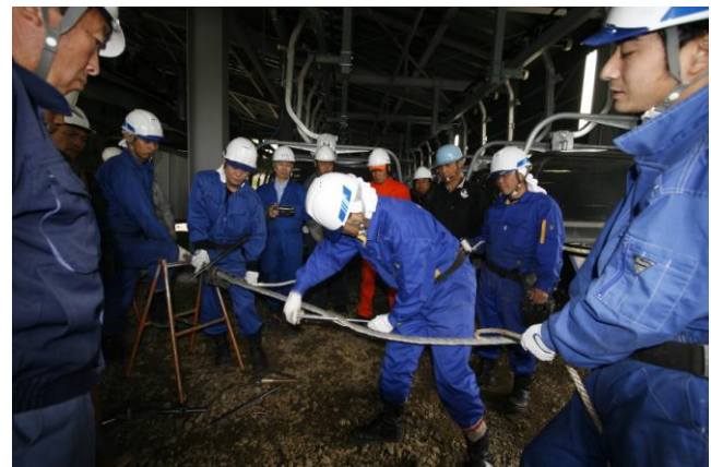
◆加森観光グループ索道担当者技術研修会(H21.11.3) 【ワイヤーロープ切詰め実技講習】