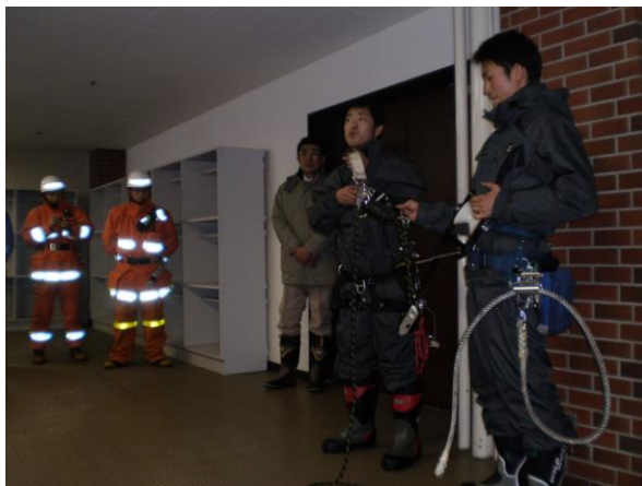
◆救助用具の取扱訓練(H21.11.20)