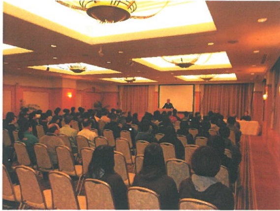
◆ルスツリゾート全従業員対象の研修会(H27.11.19)