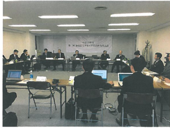
◆加森観光グループ索道担当者会議(H27.6.18)