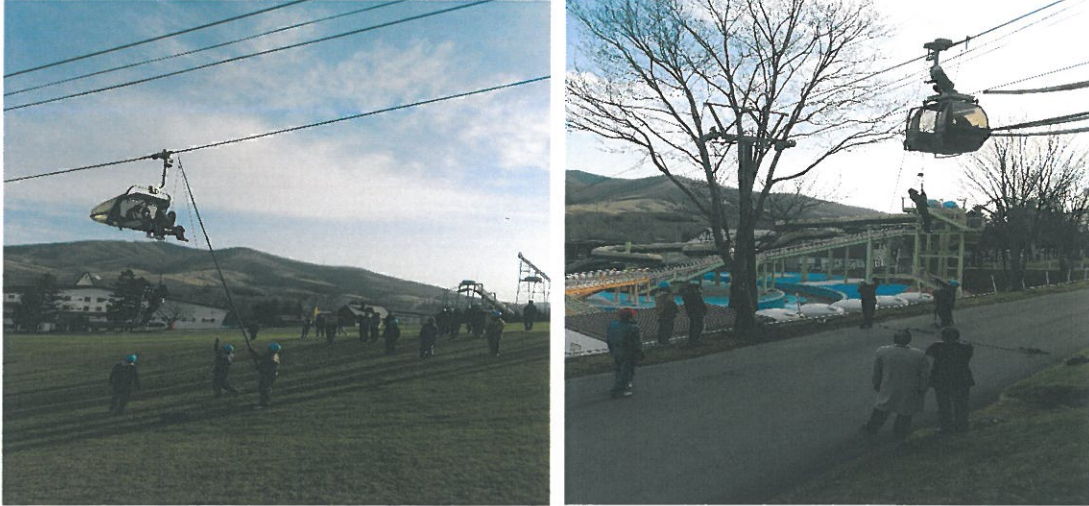
◆ 冬期営業前 4人乗リフト及び6人乗ゴンドラ救助訓練 (H27.11.21)

ルスツリゾートでは毎年、万一の「索道事故」や「災害」を想定した乗客の救助訓練や、予備原動機の操作訓練、全従業員対象の社内研修を実施し、万全の体制を整えています。