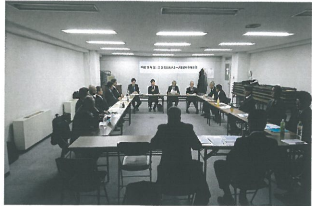
◆加森観光グループ索道担当者会議(H29.11.1)