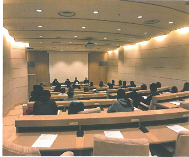
◆1月緊急ミーティング(索道事故について)