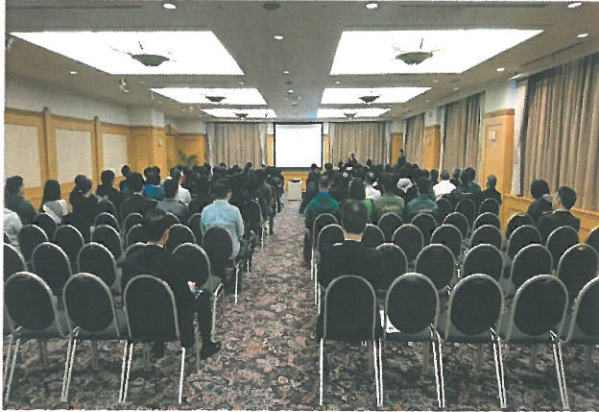
◆ルスツリゾート全従業員対象の研修会(H29.11.22)