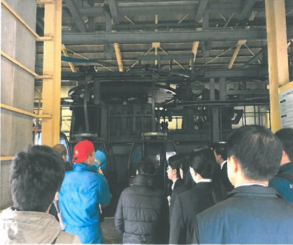
◆夏期営業前 4人乗りゴンドラ、予備原動機訓練

ルスツリゾートでは毎年、万一の「索道事故」や「災害」を想定した乗客の救助訓練や、予備原動機の操作訓練、全従業員対象の社内研修を実施し、万全の体制を整えています。