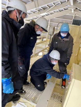
予備原動機接続運転訓練