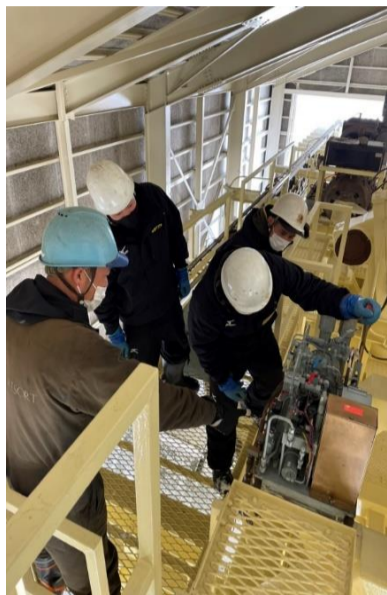
予備原動機接続運転訓練